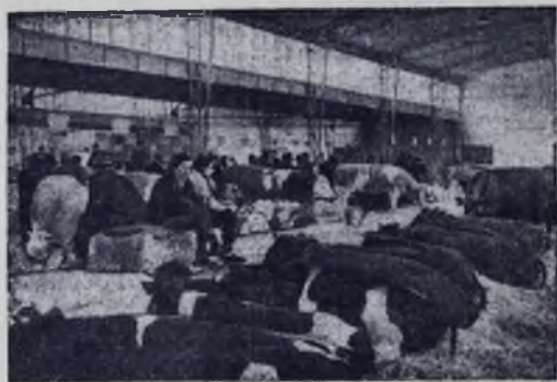
На Урале построена новая лесная гостиница. Здесь могут одновременно отдохнуть более 400 туристов, охотников и рыбаков.

На снимке: в животноводческом павильоне.