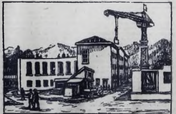
СТРОИТЕЛЬСТВО СРЕДНЕЙ ШКОЛЫ НА 520 МЕСТ В Г. БАЯКАЛЬСКЕ, КОТОРАЯ БУДЕТ ВВЕДЕНА В ЭКСПЛУАТАЦИЮ В КОНЦЕ 1962 ГОДА.