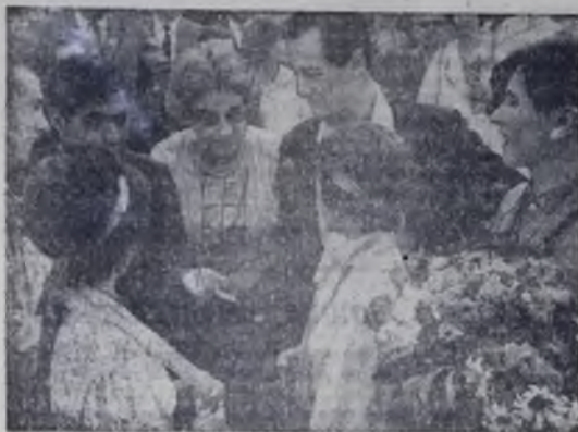
На снимке: одна из многочисленных дружеских бесед участников фестиваля. Встретились члены делегаций Советского Союза, США и Перу.