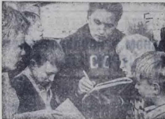
На снимке: советская спортсменка Тамара Пресс среди юных жителей финской столицы.