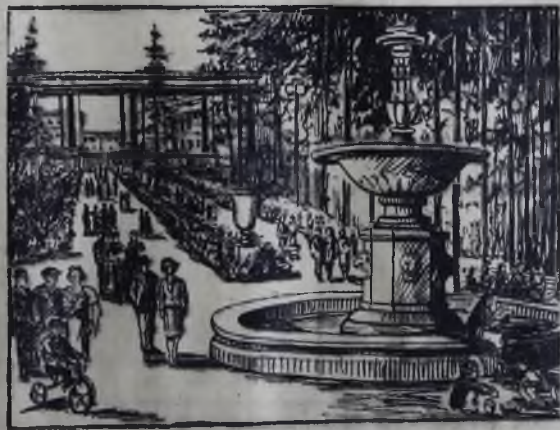
Сквер Дворца культуры. Рис. Н. ЕМЕЛЬЯНОВА.

Широкое применение этого положения даст возможность выдвигать на руководящие посты в школах талантливых, достойнейших из достойных.