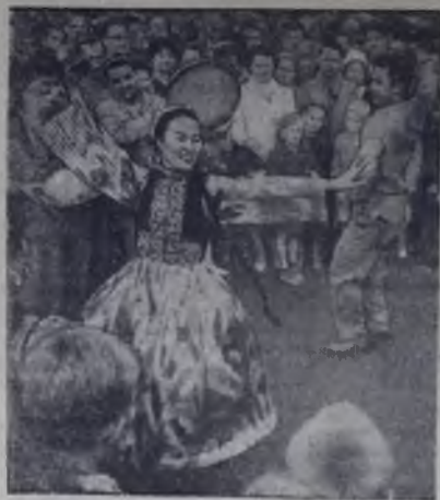
На снимке: народное искусство Узбекистана, демонстрируемое прямо на улице финской столицы, привлекло многочисленных зрителей.

август 10 — пятница — ВЕРЮ В ТЕБЯ. 13 — понедельник — ЦАРЬ ФЕДОР ИОАННОВИЧ. 15 — прощальный спектакль «РАЗБУЖЕННАЯ СОВЕСТЬ». Производится предварительная продажа билетов на все объявленные спектакли. Начало спектаклей в 20 часов.