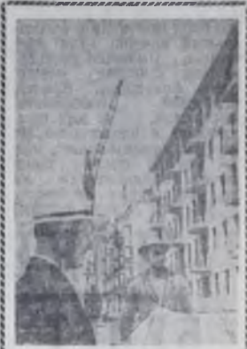
Курск. Разработан генеральный план дальнейшего строительства Курска. До 1965 года в городе будет построено 600 тысяч квадратных метров жилья, что составит половину имеющегося сейчас в Курске жилого фонда. Проектом намечено соорудить школы на 15 тысяч мест, несколько больниц, клубов, детские учреждения. Создаются новые жилые районы на 25—40 тысяч жителей. В каждом из них будут 4-5-этажные жилые дома, стадион, магазины, школы, кинотеатры.