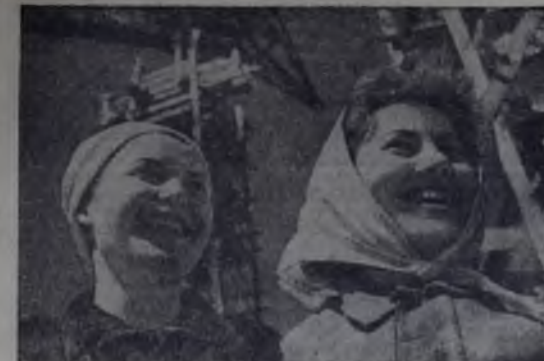
ЛЕНИНГРАД. Судостроители Адмиралтейского завода в ответ на постановление ЦК КПСС и Совета Министров СССР «О мерах по увеличению добычи рыбы и производства рыбной продукции» развернули соревнование за досрочную сдачу строящихся по последнему слову техники плавучих заводов-великанов по добыче и переработке рыбы.

ческого потенциала, — пишет американская газета. — Русские во второй половине года, по-видимому, будут продолжать увеличивать выпуск своей промышленной продукции. В Соединенных Штатах же валовой национальной продукт за 2-й квартал был значительно меньше, который предсказывало правительство. Поэтому начинают появляться опасения относительно возможного экономического спада в Соединенных Штатах.