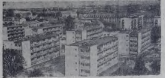
ПОЛЬСКАЯ НАРОДНАЯ РЕСПУБЛИКА. В ГОРОДЕ ПЛОЦКЕ ВЕДЕТСЯ ШИРОКОЕ ЖИЛИЩНОЕ СТРОИТЕЛЬСТВО. НА СНИМКЕ: КВАРТАЛЫ НОВЫХ ЖИЛЫХ ДОМОВ.

Орган Ангарского горкома КПСС и городского Совета депутатов трудящихся