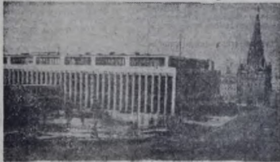
Москва. Кремлевский Дворец съездов.

Расул Гамзатов, вернувшись с Кубы, говорит: — Фидель сказал, что впервые видел кавказскую бурку, и добавил, что носит ее крепкие люди.