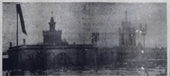
Павильон Украинской ССР на Выставке достижений народного хозяйства в Москве.

Положение может измениться лишь в том случае, если в Федеративной Республике не будет сделан поворот в сторону миролюбивой внешней и демократической внутренней политики.