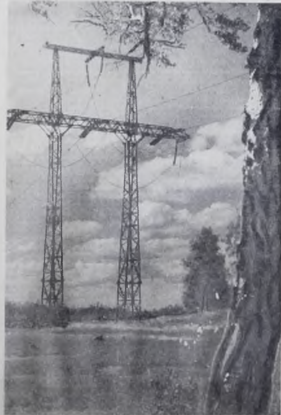
ШАГАЮТ ВЕЛИКАНЫ ПО ТАЙГЕ.