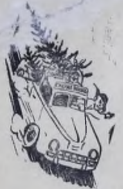
КОГДА РАССЧИТЫВАЮТ НА АВРАЛ.