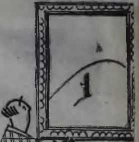
ТРАГЕДИЯ ИСКУССТВА, ИЛИ КОГДА НЕ ХВАТАЕТ ЕЛОК.