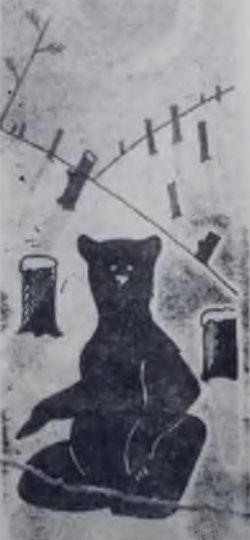
ПО ВСЕМУ ВИДНО, ЧТО НОВЫЙ ГОД НАСТУПИЛ.