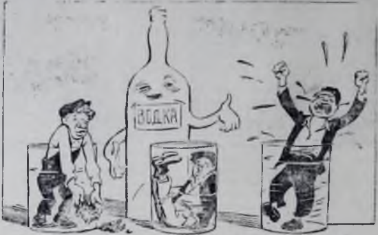
БРАК ПРОГУЛ КУЛИГАНСТВО