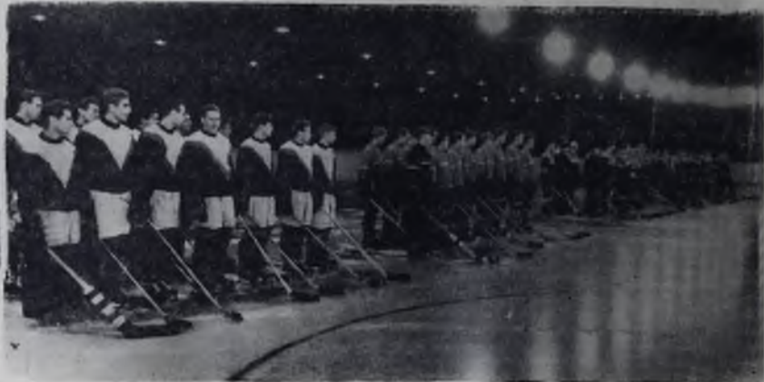
На снимке: хоккеисты Норильска, Дивногорска, Читы и Ангарска на торжественном параде, посвященном открытию зимнего спортивного сезона.

Вечером встретились команды городов Норильска и Читы. Острая и напряженная борьба закончилась победой норильцев со счетом 7:3.