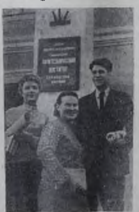
На Горьковском заводе «Красное Сормово» каждый третий молодой рабочий учится.