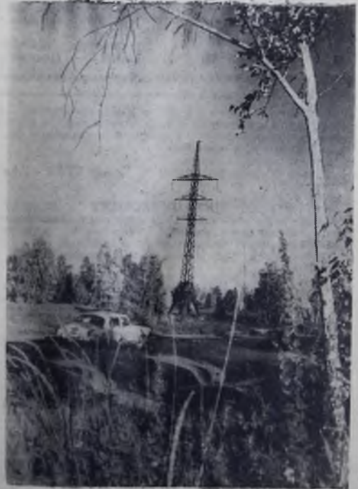
Дорога уходит вдаль.