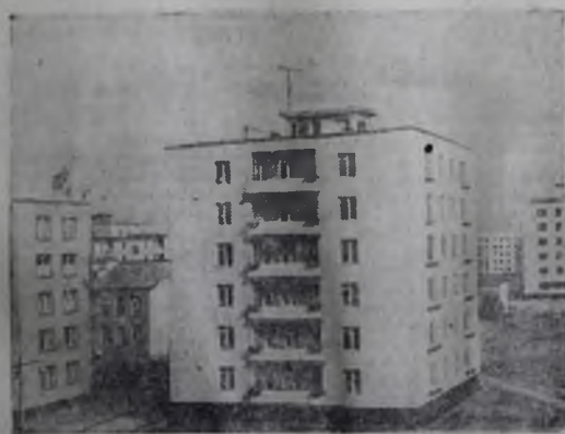
Ленинград. Впервые производство газобетонных деталей и монтаж из них жилых домов в городе были освоены Автономным домостроительным комбинатом. В настоящее время этот метод строительства получил широкое распространение. Четыре типа таких домов разработаны мастерской № 7 «Ленпроект».

Г. САЛИХАТДИНОВ, партгрупорг бригады, Г. ЕВГРАФОВ, монтажник.