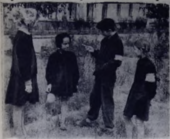
Пионерский патруль дей- ствует.