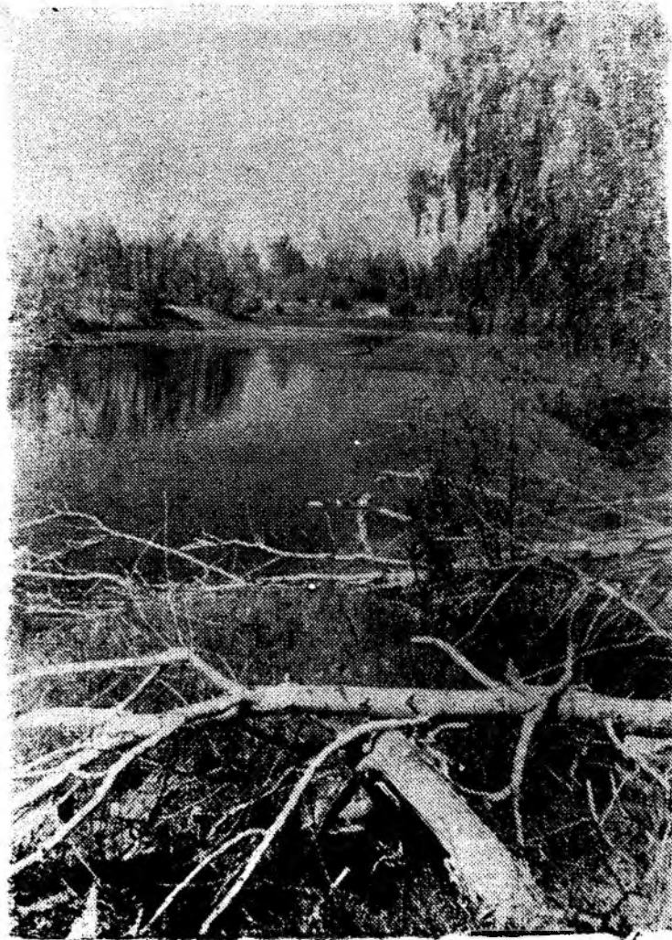
После половодья.

На сцене 12 мужчин, они зашли прямо из «зала». Это вокальная группа. Торжественно и громко звучит песня «Отзнача-