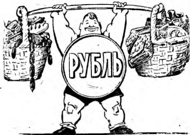
В новой весовой категории. Рис. С. Чистякова. Фотохроника ТАСС

— Тяжелый рубль! Не бывало еще таких! Рубль доверие вызывает... Хорошо!..