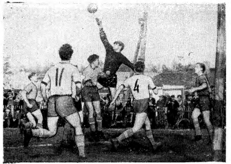
Момент игры между командами «Нефтяник» и «Труд» на первенство области по футболу.

Ангарскому холодильнику на постоянную работу требуются грузчики, кладовщик. (7)