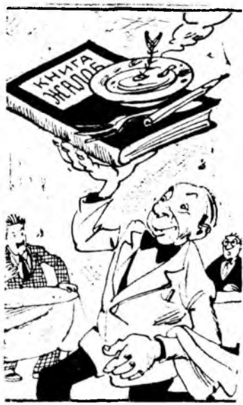
Обслуживание на высоте

В ряде магазинов и столовых плохо работают холодильные установки, продовольственные товары подвергаются порче.