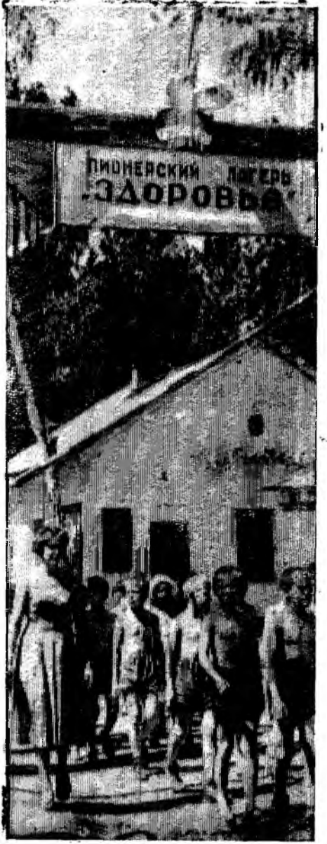
Фото и текст А. Елфимова.

А вечером, когда опускаются сумерки, над лагерем звенят веселые пионерские песни.