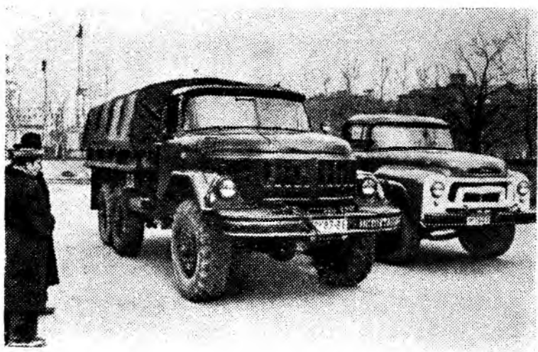
«ЗИЛ-131» — новый, очень комфортабельный вездеход — будет выпускаться взамен трехосного грузовика «ЗИЛ-157». На снимке: «ЗИЛ-131» (слева) и «ЗИЛ-130».

В экспериментальном цехе Московского автозавода имени Лихачева собраны опытные образцы грузовых автомобилей «ЗИЛ-130» и «ЗИЛ-131». Первенец семилетки «ЗИЛ-130», который сменит выпуск а е м ы й сейчас «ЗИЛ-164», имеет расширенную цельнометаллическую кабину. Он снабжен восьмицилиндровым двигателем мощностью до 150 лошадиных сил вместо шестицилиндрового стосильного, идет плавно, без толчков и может развивать с места большую скорость. На машине установлен гидравлический руль, что значительно облегчает управление. У «ЗИЛ-130» будет несколько модификаций — в зависимости от того, для каких перевозок предназначается машина.