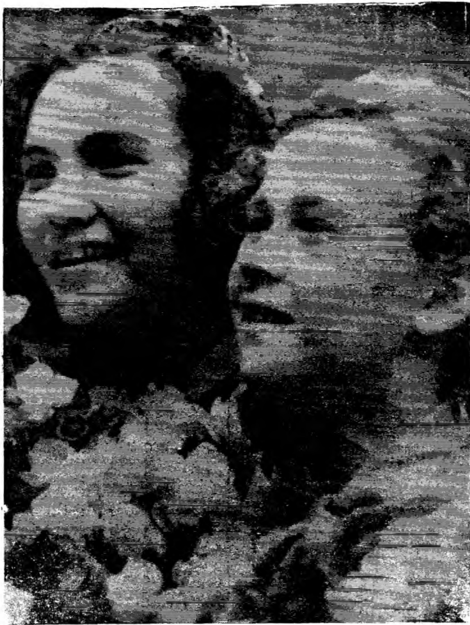
Здравствуй, праздник!

Будущее принадлежит молодежи. И тебе, молодежь, выпала великая честь строить это будущее своими руками. Как говорил поэт, «коммунизм — это молодость мира, и его возводить молодым!». Дерзай же, юность, во имя великого будущего. У молодых широкие плечи, горячие сердца, умелые руки, упорный характер. Вам, юные, вам, чей праздник сегодня мы отмечаем, открывать неизведанное, строить новое, смело шагать вперед и выше!