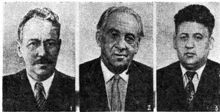
ЛАУРЕАТЫ ЛЕНИНСКИХ ПРЕМИЙ 1960 ГОДА В ОБЛАСТИ ЛИТЕРАТУРЫ.