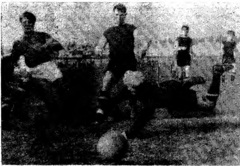
На снимке: момент игры на стадионе «Нефтяник». Читинцы атакуют ворота хозяев поля.