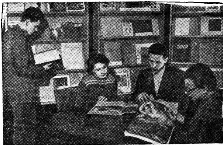
Москва. В залах Всесоюзной государственной библиотеки иностранной литературы открыта книжно-иллюстративная выставка о французском искусстве. Представлено несколько сот экспонатов. Посетители знакомятся с книгами и другими материалами. На снимке: в одном из залов выставки.