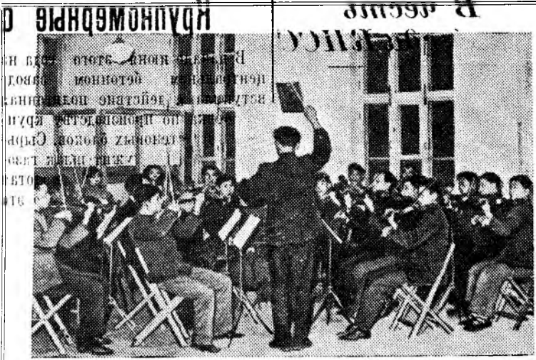
Китайская Народная Республика. В прошлом году на Anyshanском металлургическом комбинате построен новый клуб. Он стал сейчас центром культурно-массовой работы среди рабочих и служащих предприятия. На снимке: симфонический оркестр рабочих и служащих Anyshanского комбината готовится к концерту.

Прием прошел в теплой, дружественной обстановке.