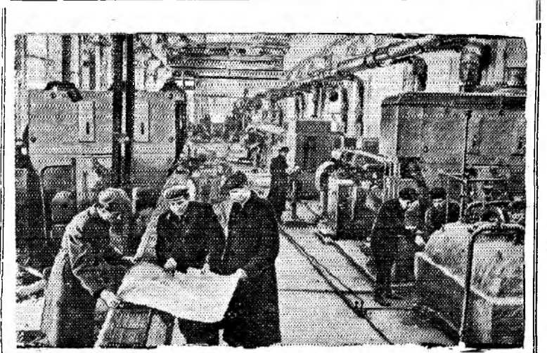
Алтайский край. На заводе «Алтайсельмаш» заканчивается монтаж автоматических линий, на которых будут изготовляться лемеха и отвалы к плугам. Две линии будут выпускать 2.200 тысяч лемехов и одна линия — 600 тысяч отвалов в год.