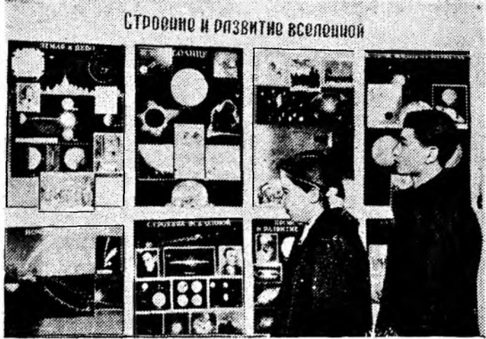
Городская библиотека широко ведет естественно-научную и атеистическую пропаганду. Недавно здесь был оформлен стенд на тему: «Строение и развитие вселенной»

На снимке: читатели библиотеки у стенда.