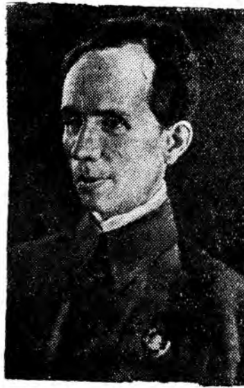
Н. А. ОСТРОВСКИЙ

Нельзя не изумляться тому титаническому труду, который проделал прикованный к постели, повседневно преследуемый мучи-