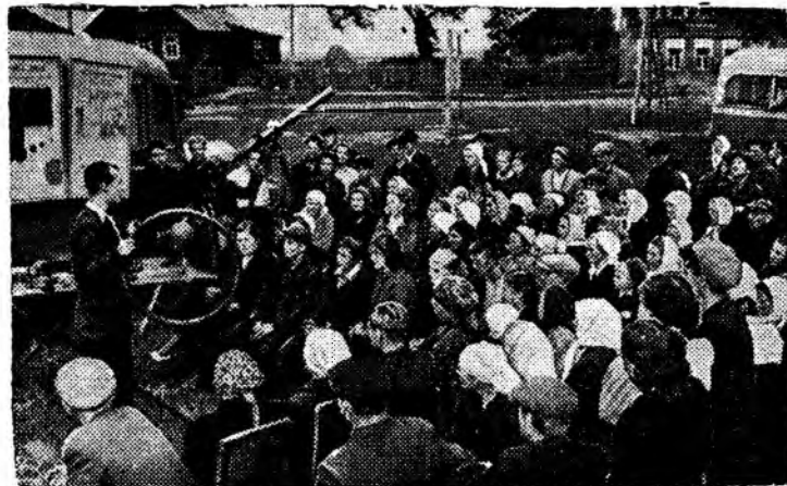
Московский планетарий регулярно проводит лекции, доклады и беседы на естественно-научные и научно-атеистические темы. Агитмашины планетария часто въезжают в районы Московской области.