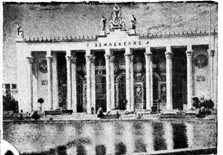
Сегодня на Всесоюзной сельскохозяйственной выставке: 1. Скульптура В. Мухиной, установленная на площади перед Всесоюзной сельскохозяйственной выставкой. 2. Павильон «Земледелец».