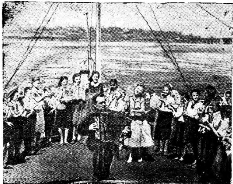
Весело провели время пионеры нашего города — участники областного слета пионеров. Пионеры совершили походы в музеи, в кино, парки.

НА СНИМКЕ: массовая пляска пионеров на палубе парохода «Советская Бессарабия».