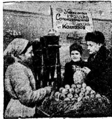
В Харькове открылся магазин по продаже сельскохозяйственных продуктов, принятых на комиссию от колхозов. Кроме этого магазина, в городе созданы девять торговых комиссионных палаток на колхозных рынках.

Эти успехи—результат творческих усилий всего коллектива, большой воспитательной работы партийной организации. Руководители предприятия воспитывают у всех рабочих чувство ответственности перед советским потребителем за качество своей продукции. Слушан браку становится предметом