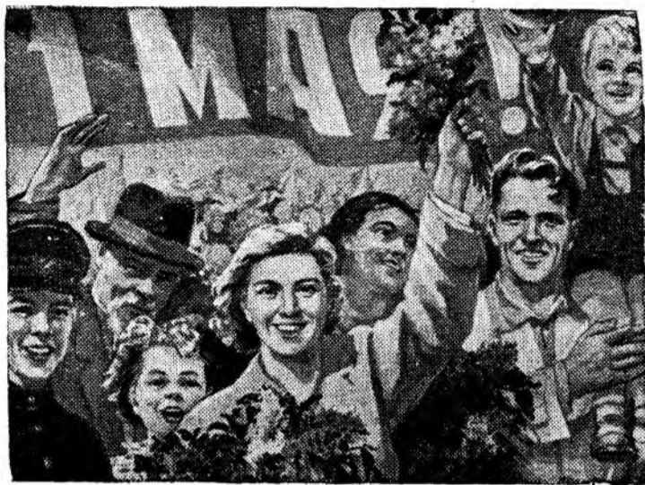
Плакат художника Н. Ватолиной (Государственное издательство изобразительного искусства), выданный к 1 Мая.

Задача партийных, профсоюзных и комсомольских организаций — мобилизовать коллектив монтажников, строителей и эксплуатационников на быстрейшее и качественное проведение всего комплекса работ, связанных с вводом в эксплуатацию межцеховых коммуникаций.