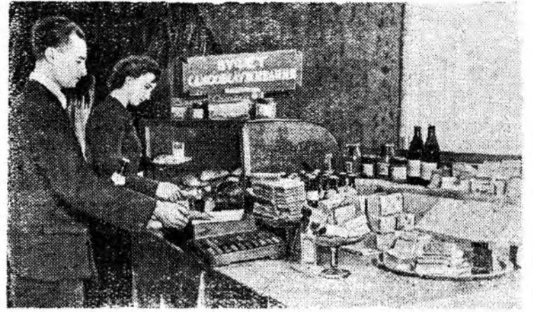
Москва. В столовой Краснохолмского комбината имеется «буфет самообслуживания», в котором продажа продуктов производится без продавца. Посетители, выбрав продукты и подсчитав их стоимость, оставляют деньги в ящике кассы.