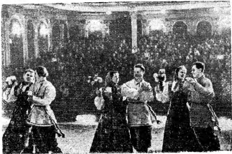
Мсаатов. Во Дворце культуры на областном смотре сельской художественной самодеятельности выступило более трех тысяч участников

НА СНИМКЕ: выступление танцевального коллектива Юсьвинского Дома культуры Коми-Пермяцкого национального округа.