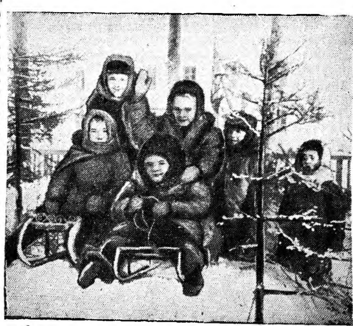
На ледяной горке.