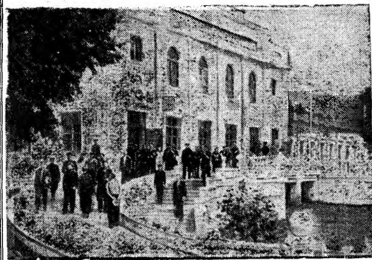
Новосибирская область. Среди сибирских здравниц большой известностью пользуется курорт «Озеро Карачи». Ежегодно здесь лечатся около шести тысяч человек. На снимке: У здания грязелечебницы.