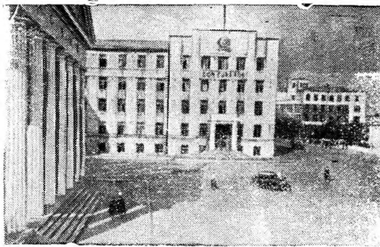
Брянск. Площадь имени Ленина.