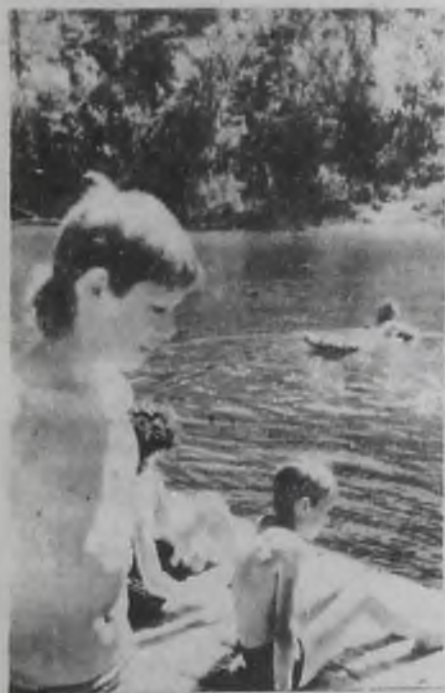
В верховьях Китая по его правому берегу раскинулась обширная зеленая зона от-

дыха. Здесь в живописнейших местах разместились туристические базы ангарских предприятий. И два выходных дня тружениками города используются с пользой для своего здоровья. Назову лишь несколько: «Ясная поляна», «Сказка», «Багульник», две «Бережки». Одна из них принадлежит Иркутскому управлению нефтепровода. Красивые скальные домики, словно пришли сюда из Берендеевой деревни, небольшие для семейного пользования избушки, прекрасная столовая, где кормят вкусно, сытно и, главное, недорого. И еще одна прелесть: на территории турбазы находится озеро, в котором в летнюю жару искупаться одно удовольствие. И надо отметить, что путевки на турбазу у нефтепроводчиков пользуются огромным спросом.