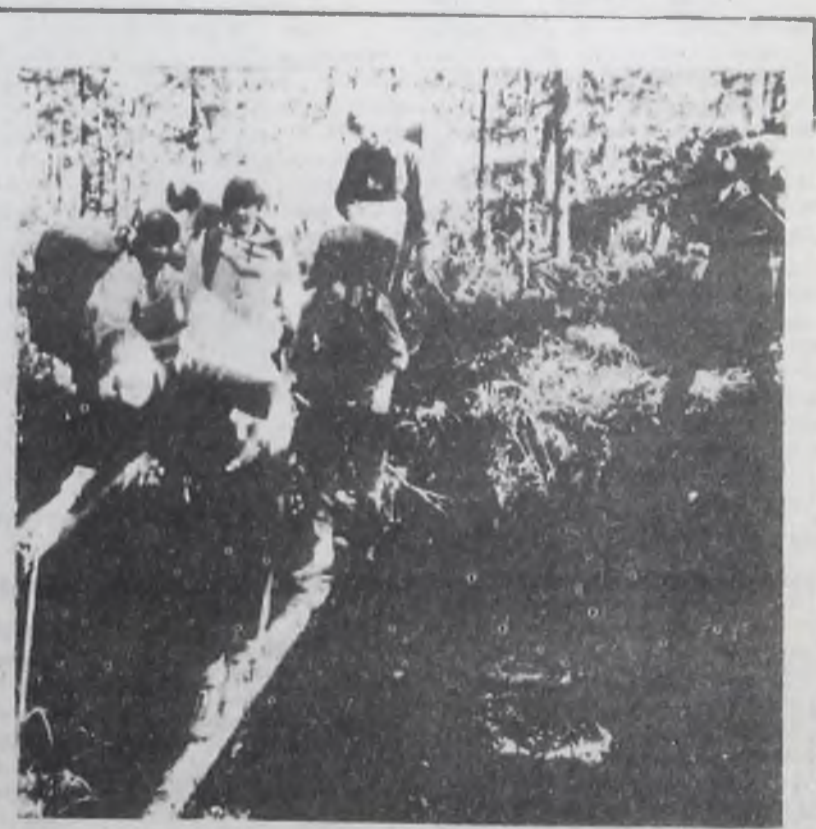
НА ТУРИСТСКИХ ТРОПАХ