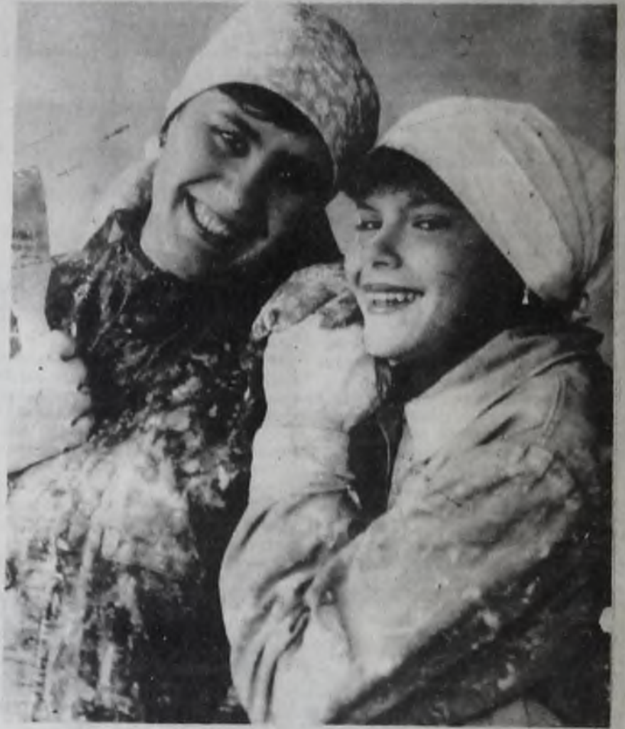
♦ Фото А. ВАСИЛЬЕВА.