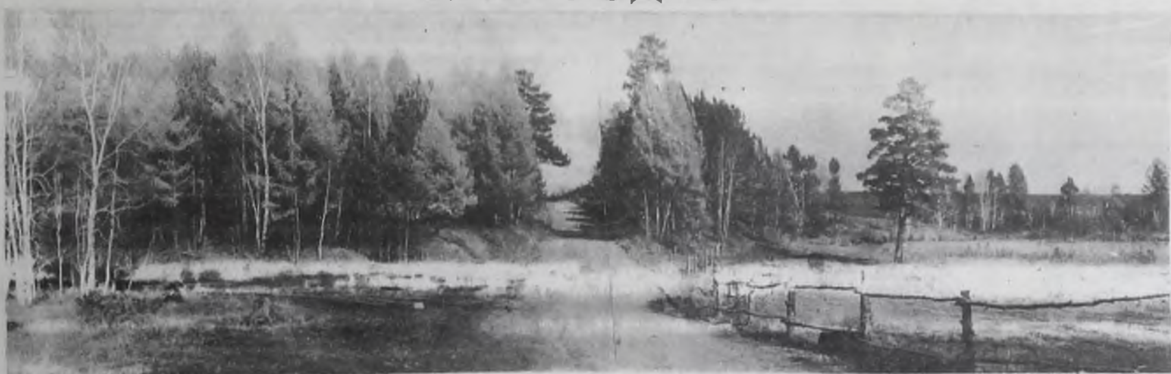
В окрестностях Савватеевки.