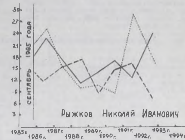
РИТМЫ ДУХА, ДУШИ И РАЗУМА ТЕЛА ДВУХ КАНДИДАТОВ В ПРЕЗИДЕНТЫ РСФСР