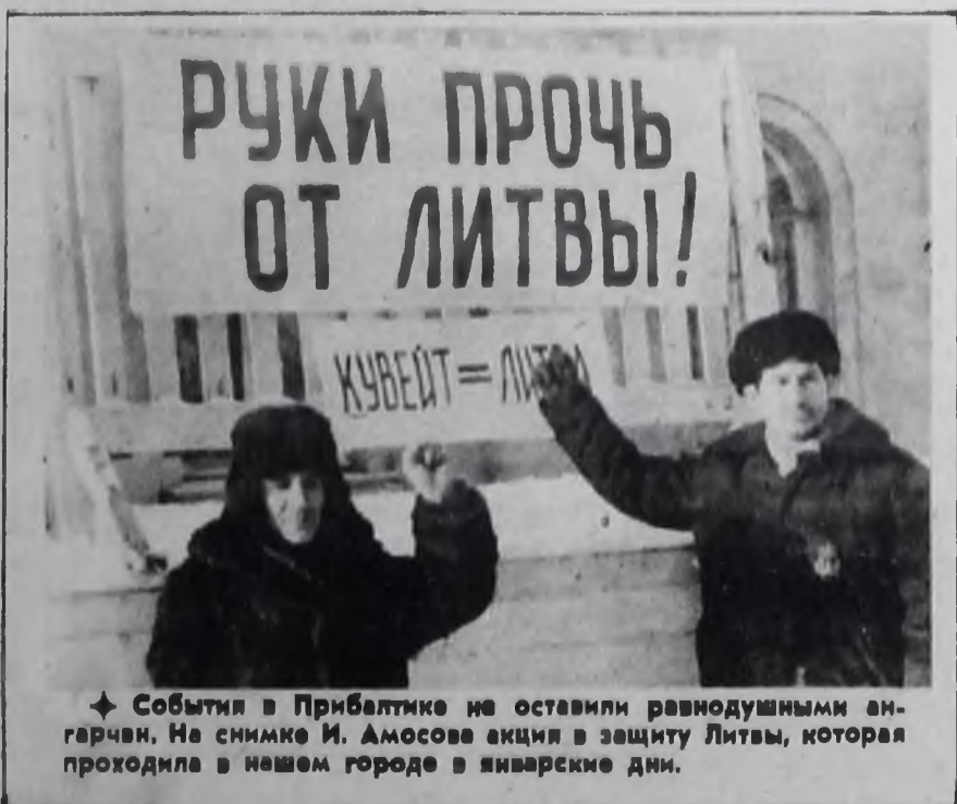
События в Прибалтике не оставили равнодушными ангарчан. На снимке И. Амосова акция в защиту Литвы, которая проходила в нашем городе в январские дни.

А сейчас вдоль кромки залива расположено множество санаториев и баз отдыха.