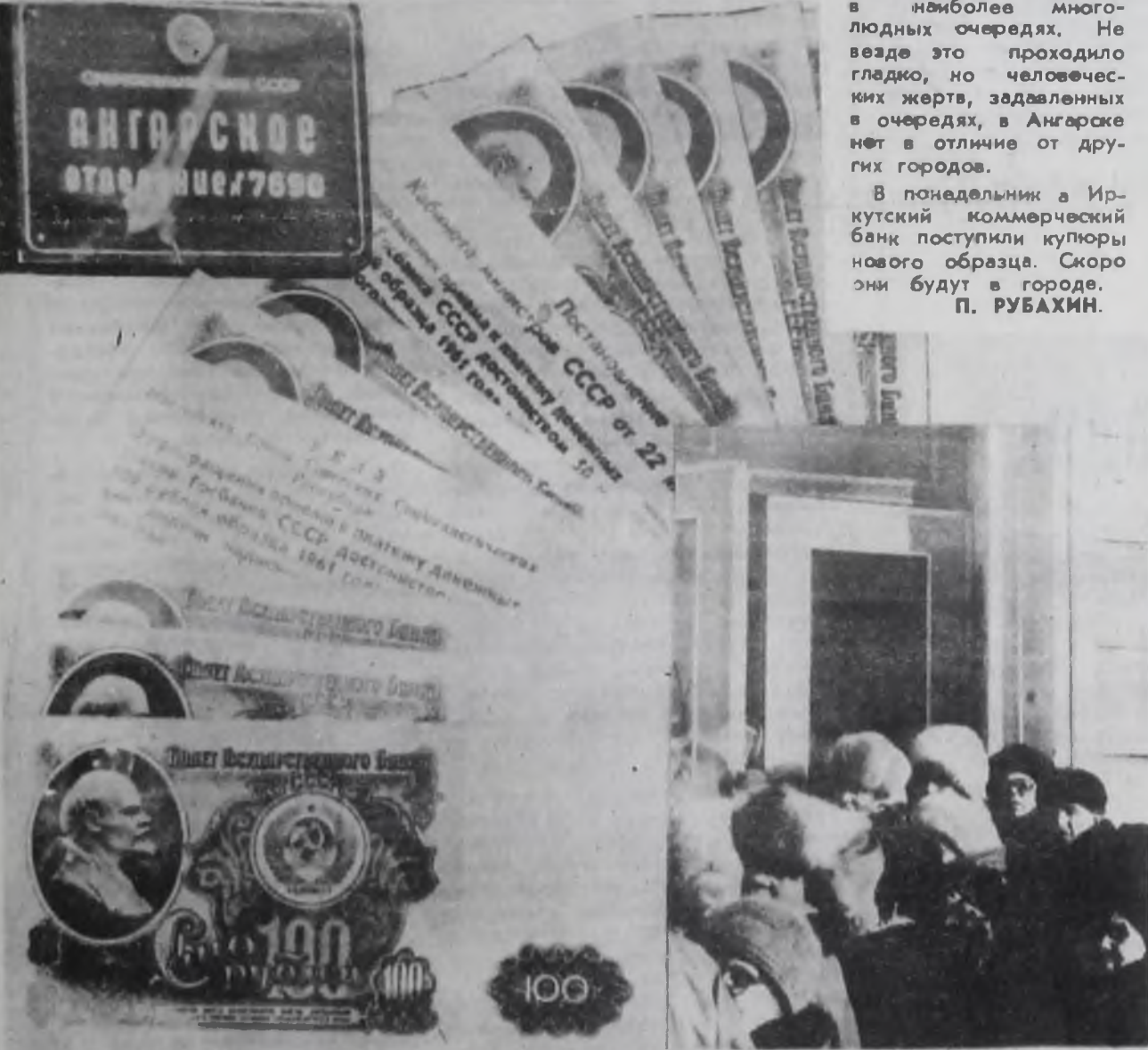
Коллаж А. СИДОРОВА.

В понедельник в Иркутский коммерческий банк поступили купюры нового образца. Скоро они будут в городе. П. РУБАХИН.