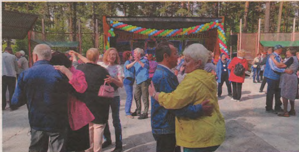
■ Настроение! Музыка! Знакомства! Место во всех смыслах замечательное.