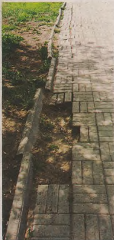
■ Новая пешеходная дорожка в сквере «Пионер».

Самый первый сквер города называется «Пионер» и находится за Дворцом ветеранов «Победа». Он же самый маленький - 1, 5 гектара.