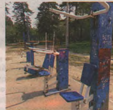
■ Тренажёры в парке строителей установлены в 2013 году. Отчитались, похвалились и...забыли, стоят без ремонта.

За озеленение этому парку пять. Просто за то, что, ставя памятник, не срубили ни одно дерево.