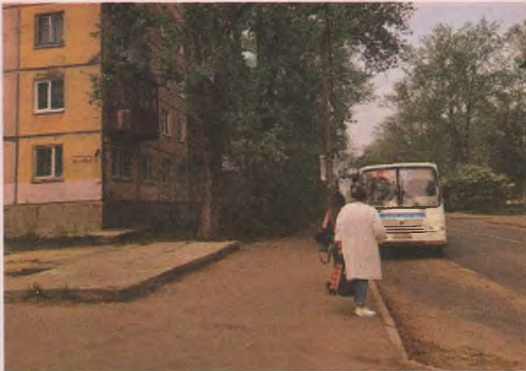
Ждать автобус №2, согласно приложению Go2bus, надо 20, а то и 30 минут. Стоя. Кто выдержит, тот молодец.