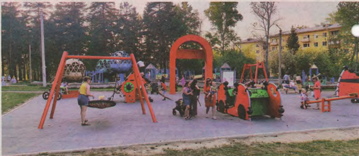
■ Парк за ДК «Современник». Детская площадка от О. ДЕРИПАСКИ.

За озеленение этому парку высший балл. Здесь ветви деревьев смыкаются над головой, по ним скачут белки. Настоящий лес в черте города. Спасибо, что живой.