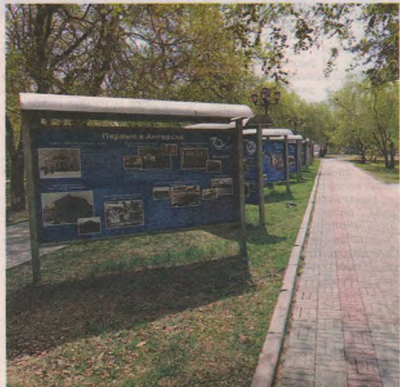
■ Это называется «музей под открытым небом» в сквере «Пионер». Кто в него ходит? Мы таких не знаем.