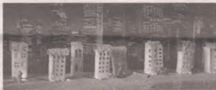
■ Инсталляция «Ночной город». Город ожил, засверкал огнями, когда в домиках-коробках из-под молока и сока вырезали окна, соорудили крыши и провели подсветку.