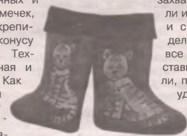
■ Ах, валенки! Их тут целая коллекция.

К Новому году в общежитии политехнического техникума появился... лес из елей. Эти зелёные деревца студенты сделали из подручных материалов - сосновых шишек, косточек сливы, сухого папоротника, фисташковых скорлупок, тыквенных и арбузных семечек, которые прикрепили к основе-конусу и покрасили. Техника несложная и незатратная. Как говорят сами ребята, студенческая. Бюджетный вариант.