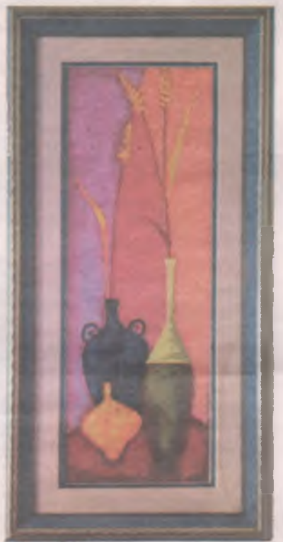
■ С этой картиной мастерица не готова расстаться. Чувствует, что вышивка должна украшать именно ее дом.

стройке познакомился, где оба работали. Родственники папы все в Америку уехали, а он с нами остался, потому что мама не захотела Родину покидать.