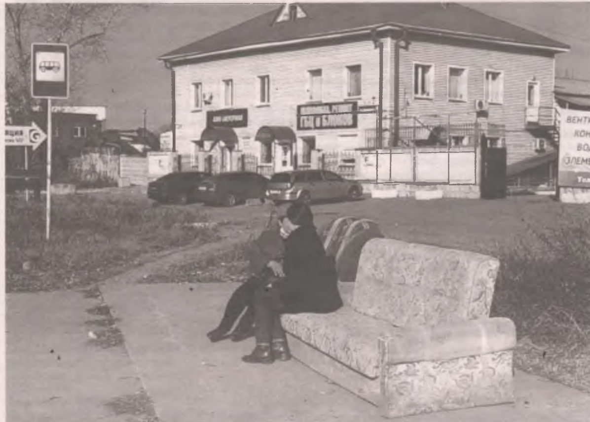
■ В отдалённых районах людям тоже нужны нормальные остановки, хотя бы лавочки. Вот так в Майске люди организовали себе «остановочный павильон» из того, что было.