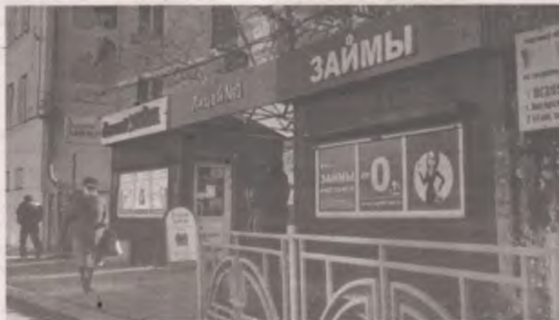
■ В городе более 120 остановок, совмещённых с киосками. О едином стиле нет и речи.