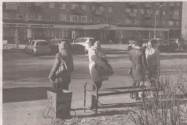
■ Остановка напротив МФЦ. Место оживлённое. Ходит здесь только автобус №28, который, если упустил, полчаса жди следующий. Лавочка всего одна. А если дождь?

власти при разумном подходе направляют полученные средства на обустройство хороших остановок. Но пока это не наша история.