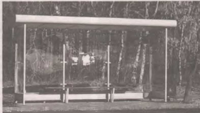
■ Один из новых остановочных павильонов, установленных в 2019 году. Есть и лавочка, и крыша, и даже стены. Но вот проблема: в жару там как в теплице.

КУМИ регулярно проводит аукционы на право использования земельного участка на размещение киоска или павильона, совмещенного с остановкой. Вот недавно, согласно протоколу аукциона от 1 октября 2021 года, участок напротив магазина «Магистральный», на Ленинградском проспекте, был отдан под остановочный павильон-нестационарный торговый объект предпринимателю, предложившему наибольшую цену в размере годовой платы 44061,76 рубля. Согласно документам администрации АГО, всего в городе более 120 киосков и павильонов, совмещенных с остановками. Можно прикинуть, какая сумма поступает в городской бюджет за размещение киосков и павильонов, в том числе на остановках. Это распространенная практика: городские