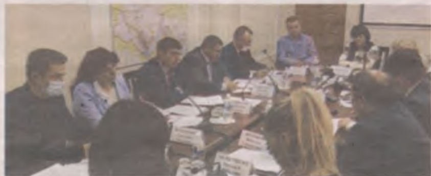
■ Депутаты Заксобрании назначили следующее обсуждение проблемы расселения аварийного жилья на весну 2022 года.

Удастся ли расселить следующие 400 тыс. кв. метров, пока неизвестно. В 2019 году было расселено 28 тыс. квадратных метров, в прошлом году