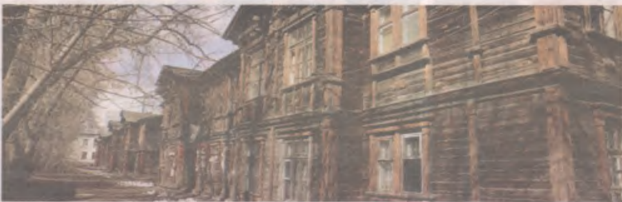
■ В ветхих и аварийных домах Иркутской области живёт больше 20 тысяч человек.