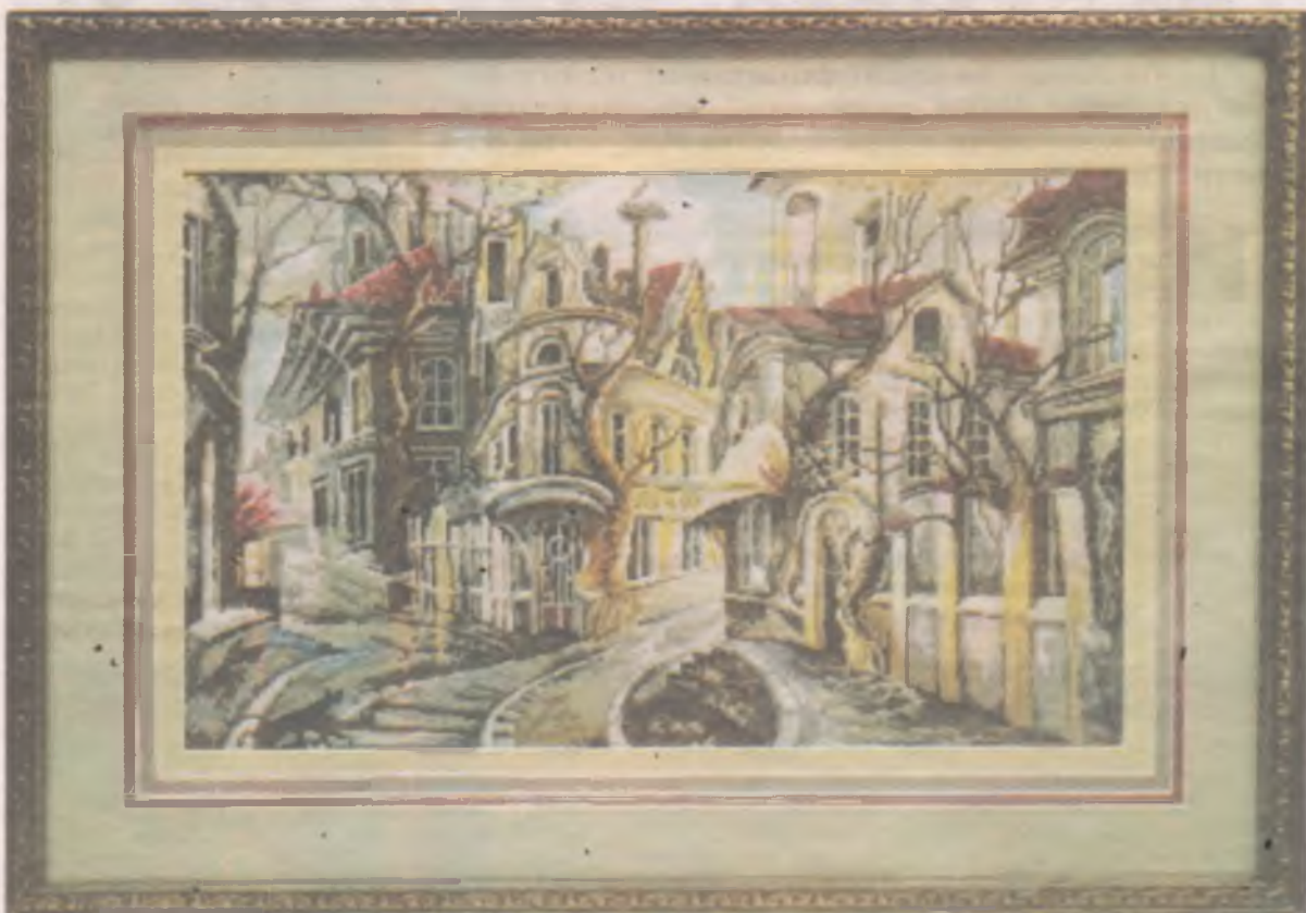
■ Город мечты: тихие улочки, старинные домики и никаких масок.