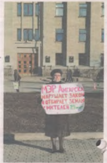
21 октября 2021 г. На одиночном пикете в Иркутске.

в помощь, проверила документы и уехала. Жителям посоветовали не препятствовать работам, иначе уже полицию вызовет другая сторона и сотрудники будут вынуждены остановить хулиганство.