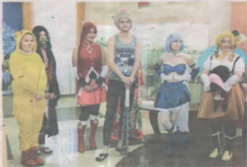
На открытие выставки косбенд переоделся в персонажей из двух аниме - «Клинок, рассекающий демонов» и «Девочка-волшебница Мадока МАГИКА».