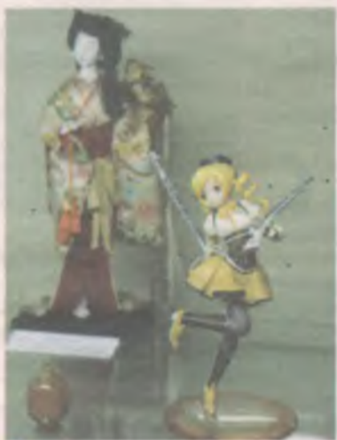
Выставка японских фигурок аниме в выставочном зале на улице Глинки, 25, продлится до 3 ноября.

Движение стало набирать популярность в 2010 году, сейчас многие участники косбенда взрослые работающие люди. Юлия Артемова - преподаватель детской художественной школы № 2. Алла ЯКОВ-