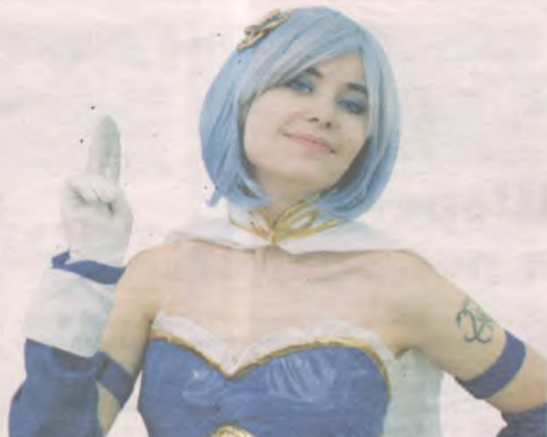
На Алле костюм в синих тонах, голубой парик и ярко-синие линзы. Образы косплееры продумывают вплоть до цвета глаз.

скоро у меня это пройдет. А сейчас показываю мои фотографии в костюмах коллегам! Да и вообще это интересно, жизнь у нас не однообразная и не унылая.