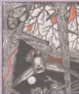
ТЕСТ НА СТАРЕНИЕ МОЗГА

На самом деле не так уж просто вспомнить математику за 3-й класс. Арифметические действия выполняются слева направо по порядку, но от существующих действий вычитание и выношение правого считаем. Ответ - 12.