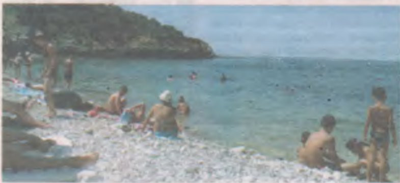
Народу на Черноморском побережье нынче много. Но народ на море угнетает меньше, чем толпа в автобусе.

Для въезда, кстати, ни прививочный сертификат, ни тест не требуются в случае, если вы снимаете квартиру. А вот если планируете отдых в санатории - готовьте документы.