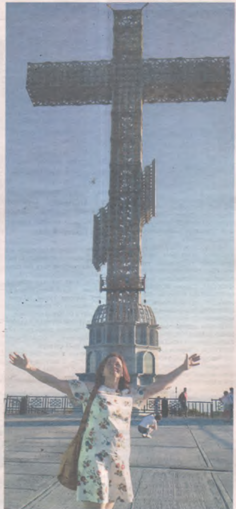
Молитва на высоте 580 метров над уровнем моря доходит быстрее до адресата. Православная часовня на горе.

Общепит тоже для любого кошелька. От столовых до ресторанов. Рекомендуем не стесняться