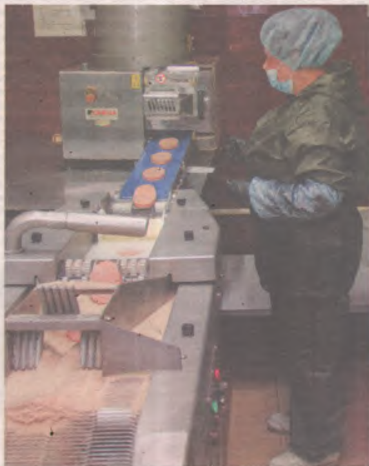
■ С полуфабрикатами готовить легко.