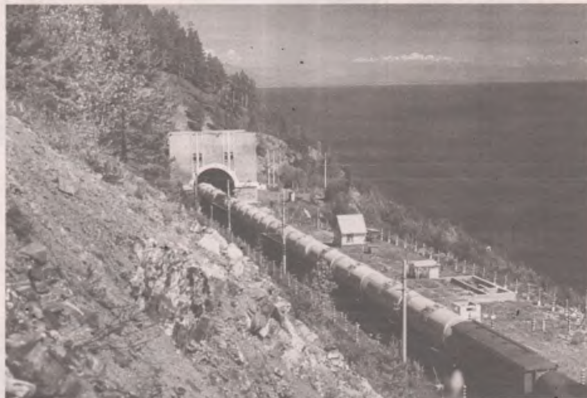
■ Один из мысовых тоннелей.

Валерий ДМИТРИЕВСКИЙ, фото из личного архива