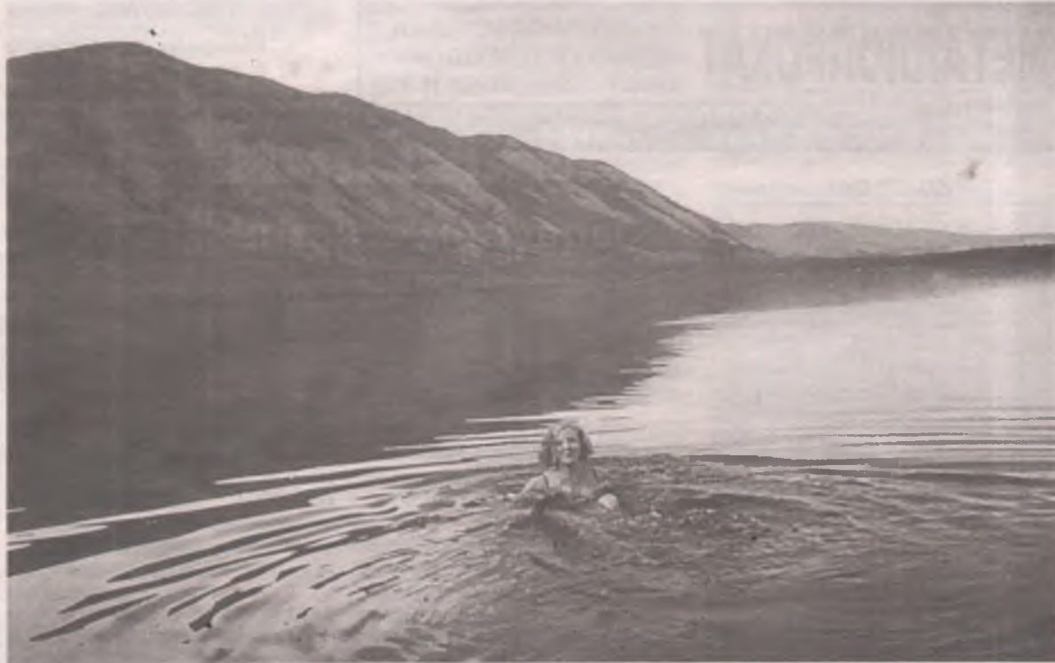
■ Слюдянские озера не случайно занимают третье место в рейтинге «Семи чудес Бурятии».

Любителям дикого отдыха в этих краях тоже раздолье. С автомобильной дороги, проложенной между Северобайкальском и Нижнеангарском, можно выйти на байкальский берег, поставить палатку и жить в своё удовольствие. Или уехать куда-нибудь по трассе на таёжные речки, которых в округе немало: Тья, Нюрн-дукан, Гоуджекит, Кичера... Рыбалка на хариуса почти всегда будет успешной. А осенью в ле-