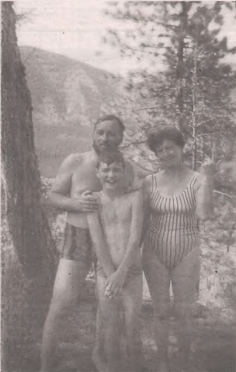
■ Работа, семья и чудесная природа, а больше ничего и не надо для счастья.