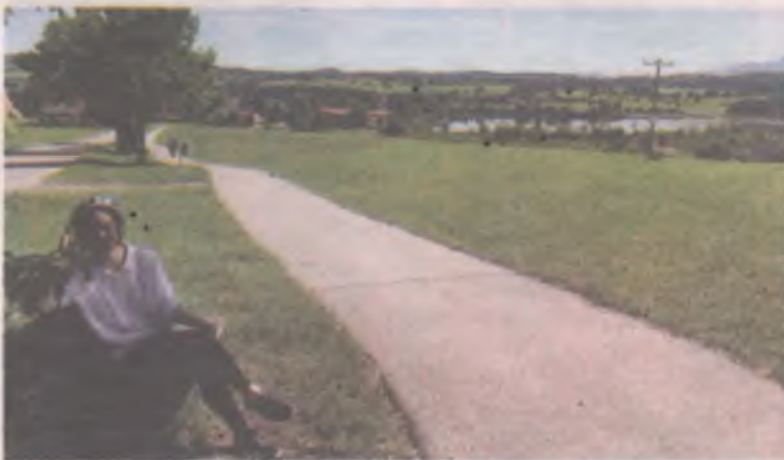
■ В Германии и пешеходы, и велосипедисты чувствуют себя в безопасности.

Анна КОКОУРОВА