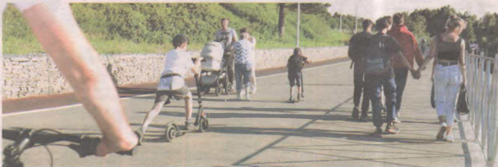
■ Самокат может разогнаться до 50 км в час, но до сих пор не считается транспортным средством.

Вкус к прогулкам как следует распробовали к лету прошлого года. Заметно прибавилось и пешеходов, и едущих. Поспособствовала и пандемия с закрытыми детскими лагерями. Детские площадки прошлым летом были буквально облеплены разновозрастной детворой. Плюс открылись прокатные пункты самокатов в трех точках набережной. А это 70 передвижных средств, не считая тех, что приоб-