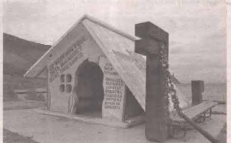
■ Каменная палатка – памятник первым строителям БАМа.

“ Вода с температурой около 45° вытекает из двух источников, один из них бьёт прямо из скалы. ”