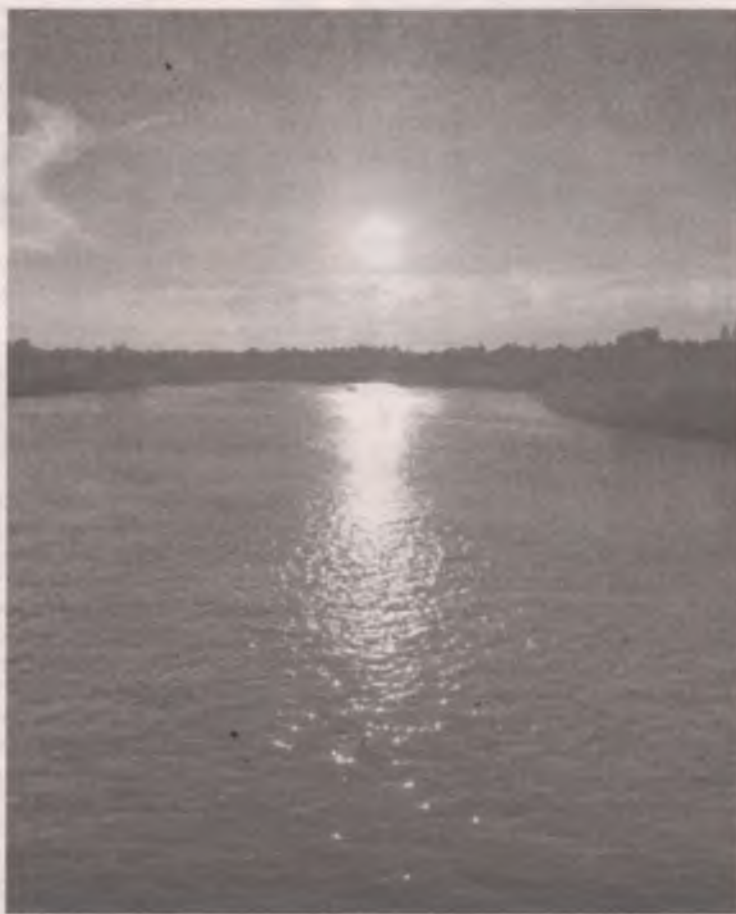
■ Река Китой перед закатом.

Буряты - люди трудолюбивые, скотоводы, держат коров, лошадей, овец, свиней. Кормят близлежащие деревни и садоводства мясом и молоком. Трудно представить, к примеру, как бы жила Якимовка без Чебогор. Они сеют овес, косят ароматные травы на сено. Но