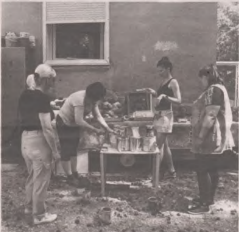
■ «Перекрёсток» призывает не выбрасывать мягкие игрушки и приглашает к участию в проекте всех желающих: вы можете присоединиться к инициативе или помочь цементом, кистями, красками, которые остались после ремонта. Связаться с активистами можно в Инстаграме (tos_perekrestok38).