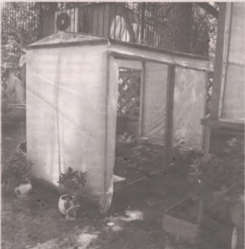
■ Если у вас нет дачи, берите пример с наших героев, которые за домом организовали небольшой огород.