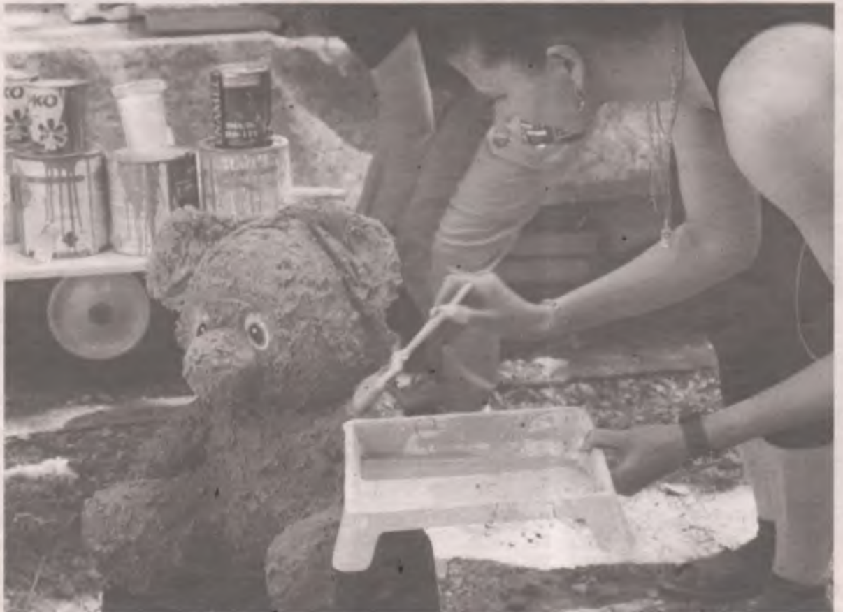
■ Мишка, облаченный в новую цементную одежду, приобретает яркий бирюзовый цвет.

Анастасия МАМОНТОВА