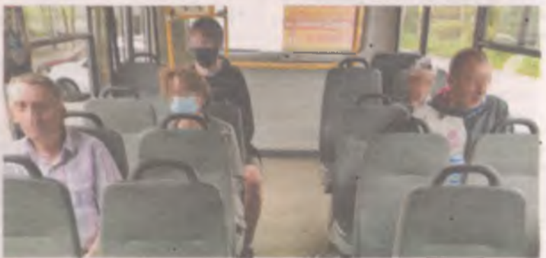
Ангарский автобус. Из пяти пассажиров маски только у двоих.