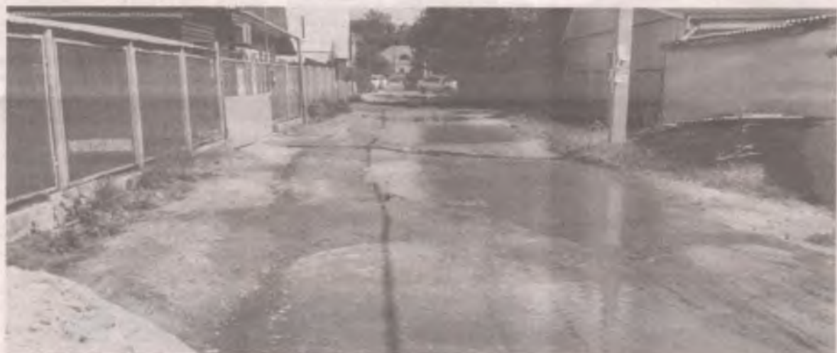
■ Микрорайон Северный. Улица Профсоюзная. После дождя не проехать.

Анастасия ТЮЛЬПАНОВА