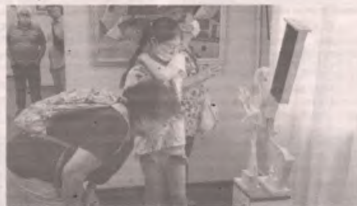
■ Мимо авангарда просто не пройдешь.