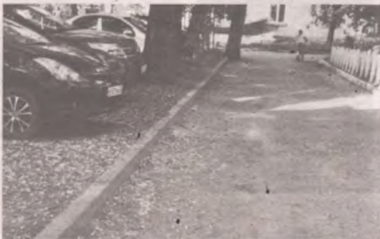
■ На фото двор дома №18 в 49 квартале. Трактор с уборкой прошёл, а двор чистым не назовёшь.

Дело хорошее. Но не все, как оказалось, от этого в восторге. По словам части жителей 49 квартала, по дворам прошел небольшой трактор со щеткой, размазал грязь, ошметки раскидал. Такая картина в районе дома №18 в 49 квартале: местами чисто, местами замусорено. Как будто не убрали за трактором. Очевидно, что уборка должна быть не только технологичной, но и законченной.