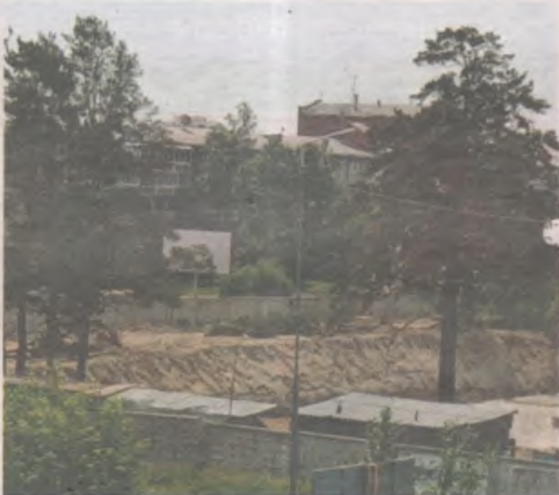
7 июля 2021 года. На участке продолжаются стройка и вырубка деревьев. Что бы ни решил суд, сосны здесь уже не встанут.

«Проверкой установлено, что собственники жилых помещений многоквартирного дома № 54 в 34 микрорайоне не выражали своего мнения по вопросу раздела зе-