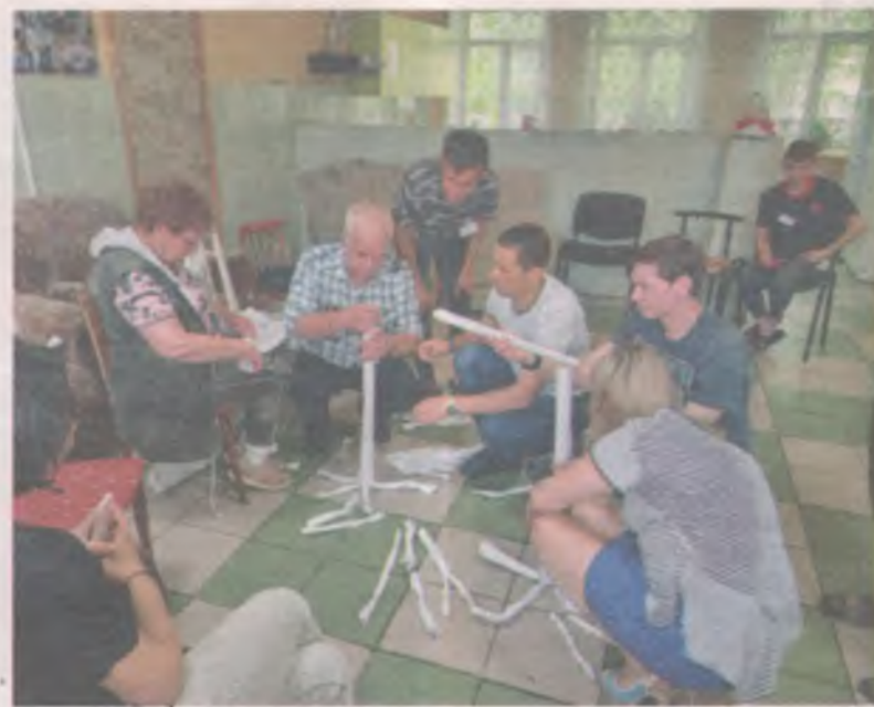
Тренинг проведён на средства благотворительного фонда «Дети Байкала», выигравшего конкурс Губернского собрания общественности Иркутской области.

Хотите узнать, есть ли в вашем коллективе команда? Проведите такой тренинг. Ваш корабль после долгой межзвёздной экспедиции спускается на Землю, где разумная жизнь существует в другой форме - энергетической. Новые жители планеты предлагают экипажу два варианта: переход в