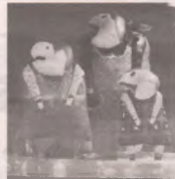
■ Семейка тряпичных кукол. Работа Клавдии ЛИПАТОВОЙ.

97 произведений живописи, графики, скульптуры создали в выставочном зале уникальное пространство. Оно цепляет зрителя и меняет его, а значит, и окружающий мир. А это то самое, к чему стремились художники-а-