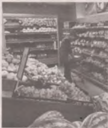
■ Цены растут как на дрожжах.

К летнему сезону подорожали роликовые коньки (на 10%), мотоциклы (на 4%), новые легковые автомобили отечественного производства (на 2%). Почти без изменений остались цены на посуду, женскую и мужскую одежду